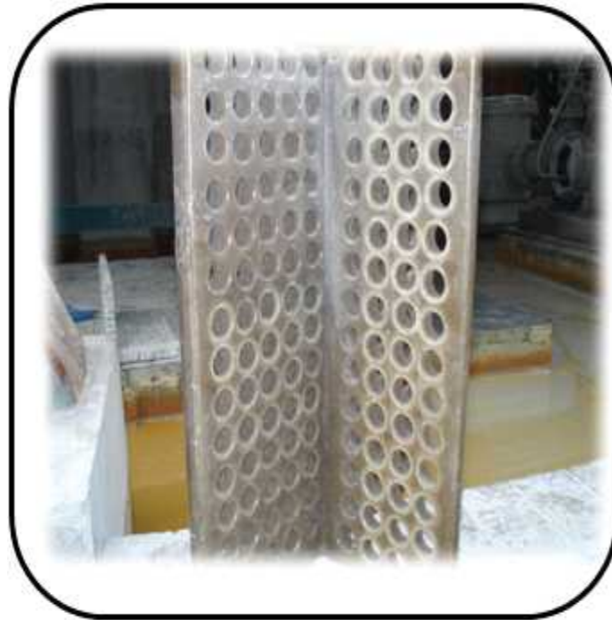
MIXER SETTLER 제작, 설치