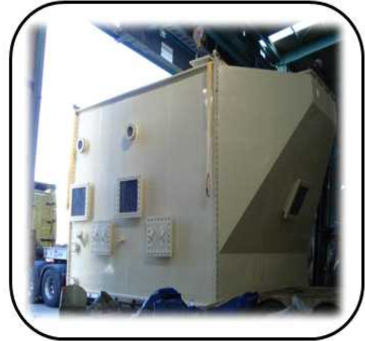
LGD P6E 환경설비공사(악취제거설비공사)