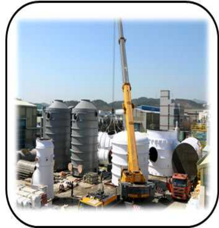
PJT FRP EQUIPMENT 운반작업