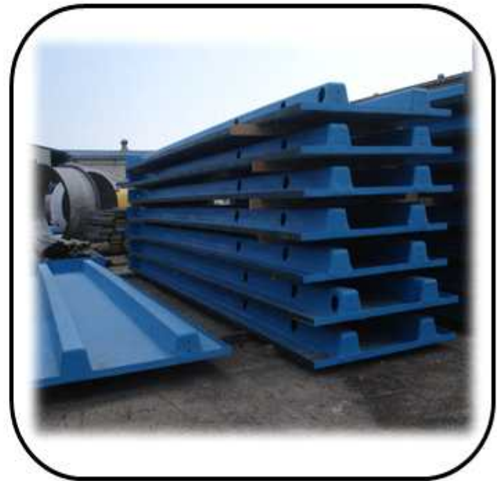
냉각탑 PANEL 제작