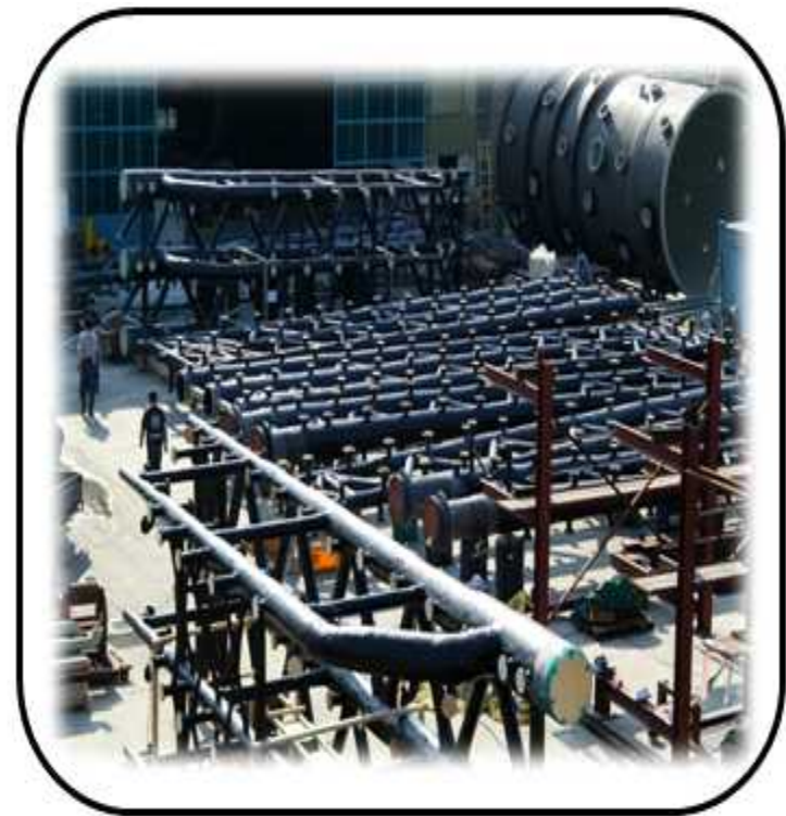
SPRAY HEAD 제작