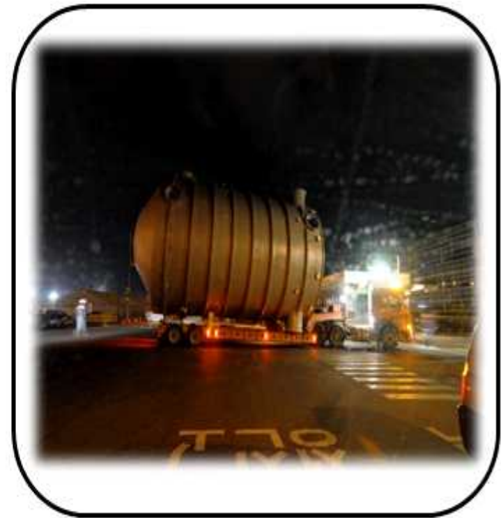
PJT MIST-EP 개조 공사 야간 운반작업