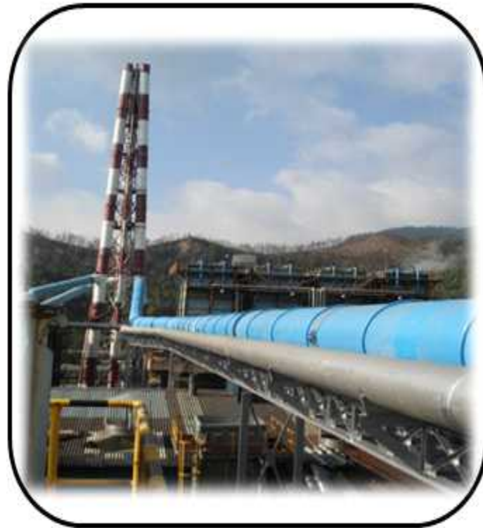
STACK & DUCT 제작, 설치