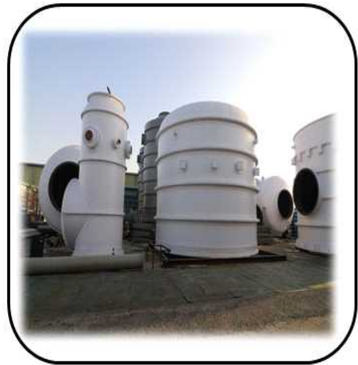
PJT FRP EQUIPMENT