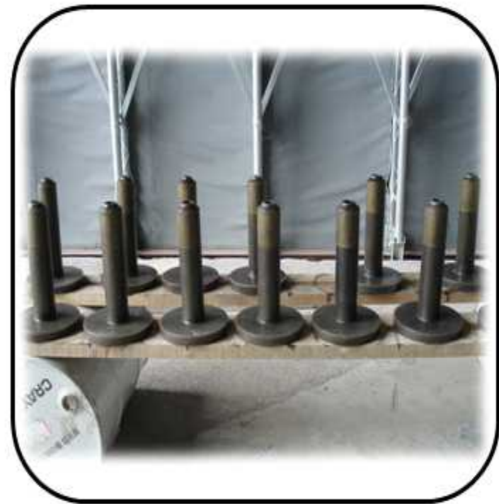
SPRAY NOZZLE 제작