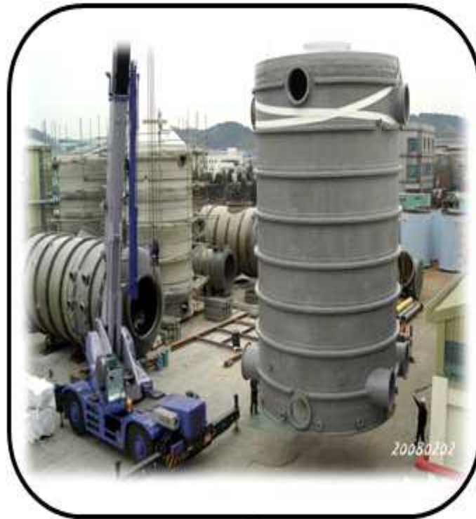
PJT MIST-EP 개조 공사 운반작업