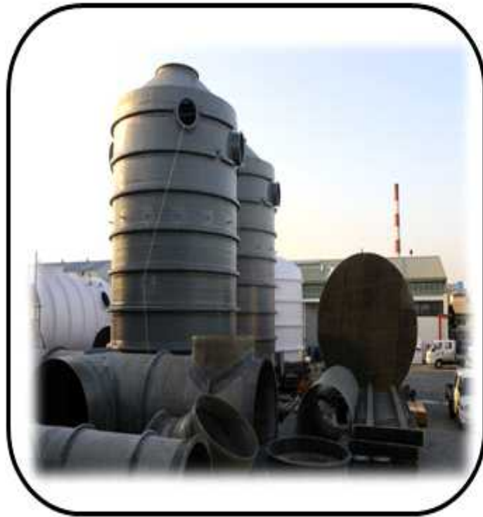
PJT MIST-EP 개조 공사