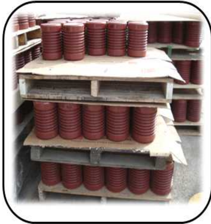
INSULATOR 제작, 납품