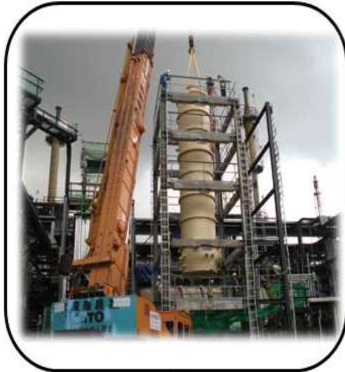
SK energy SAR Wet Gas Eliminator