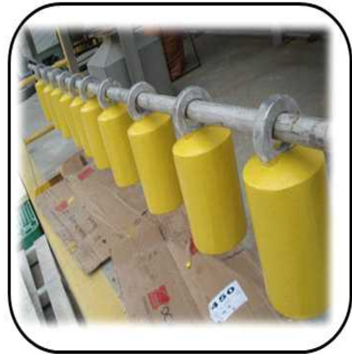
INSULATOR 제작, 납품