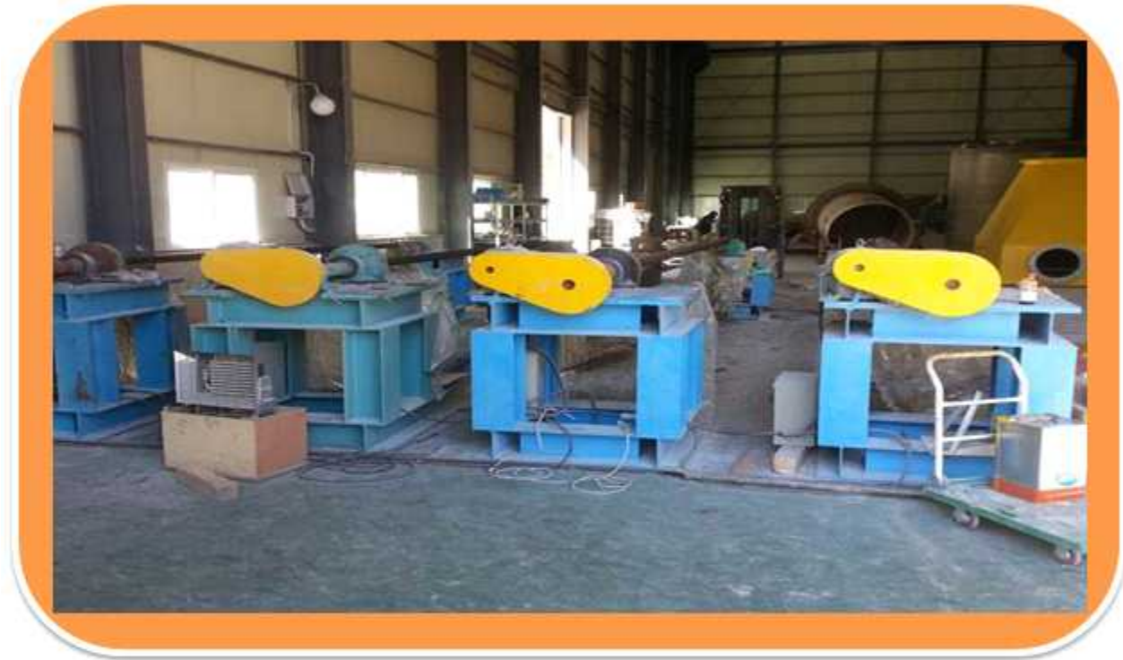
↑ 내식기 작업