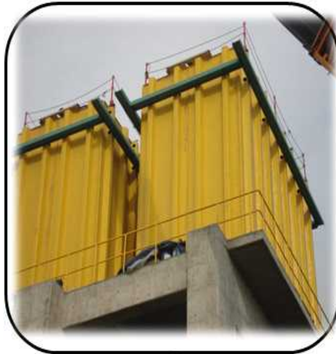
COOLING TOWER 제작, 설치