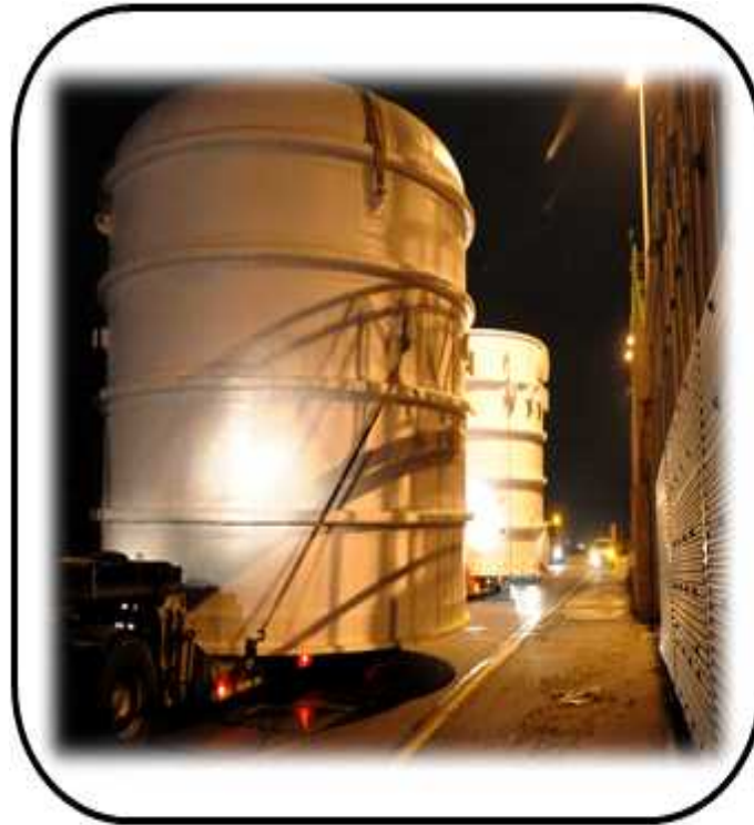
PJT FRP EQUIPMENT 야간 운반작업