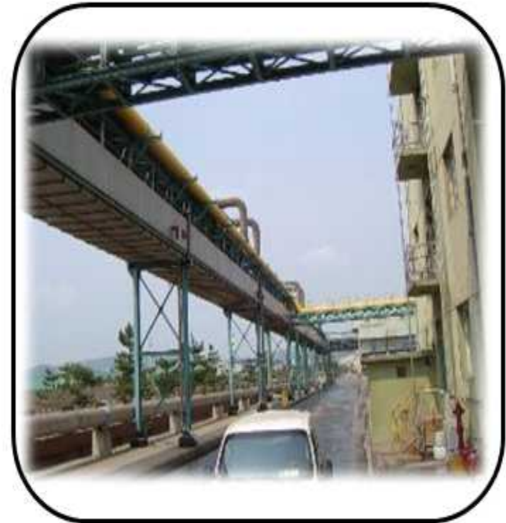
DUCT 제작 설치