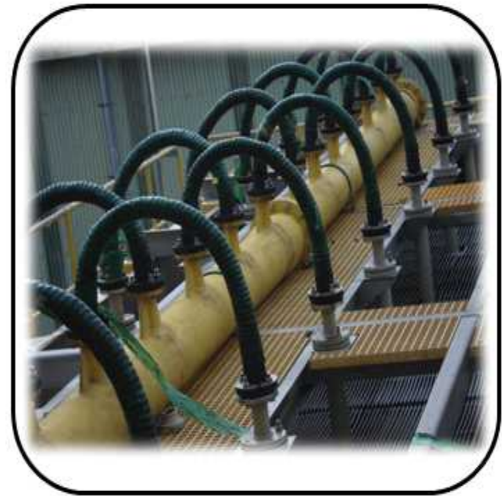
SPRAY HEAD 제작, 설치