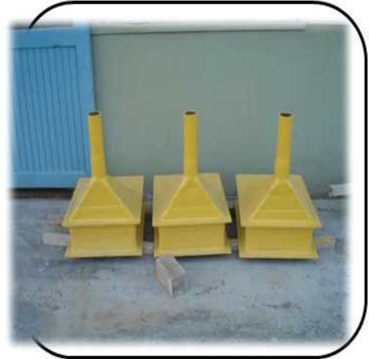
PH. CHAMBER용 액받이 제작