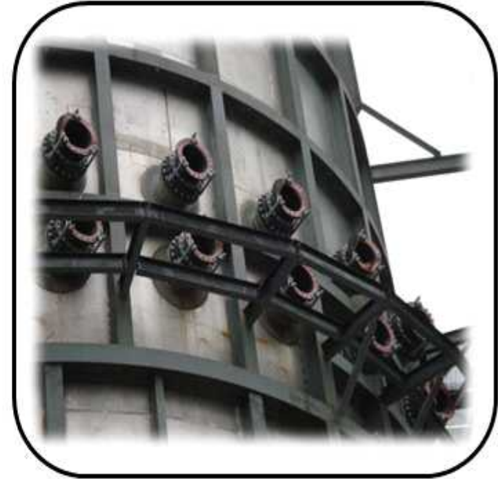
SPRAY HEAD 설치