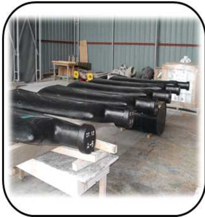
FAN BLADE 제작