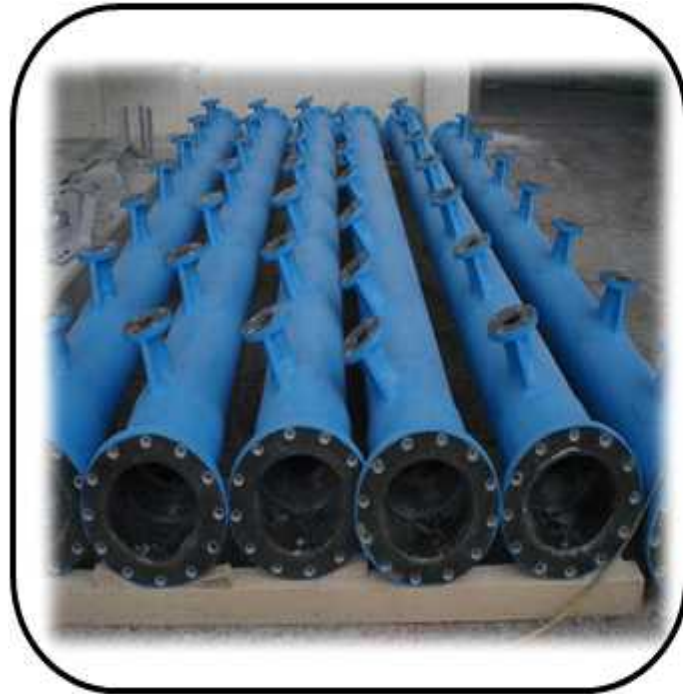
냉각탑 HEAD 제작