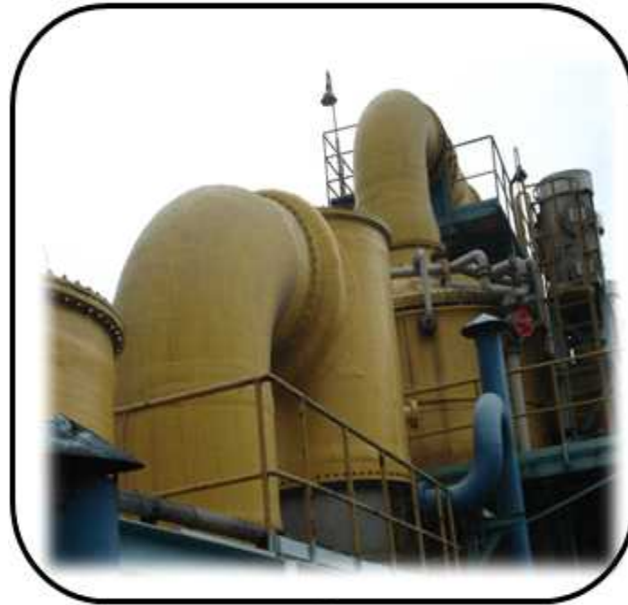
EXPANSION 제작, 설치공사