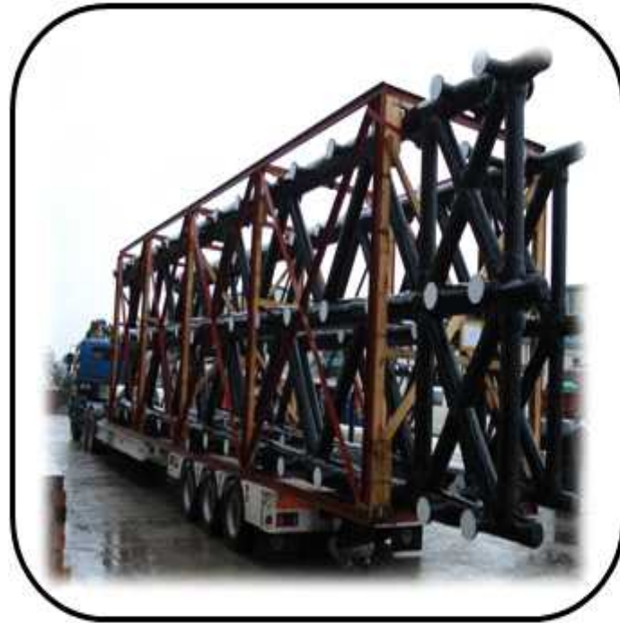
SPRAY HEAD 운반