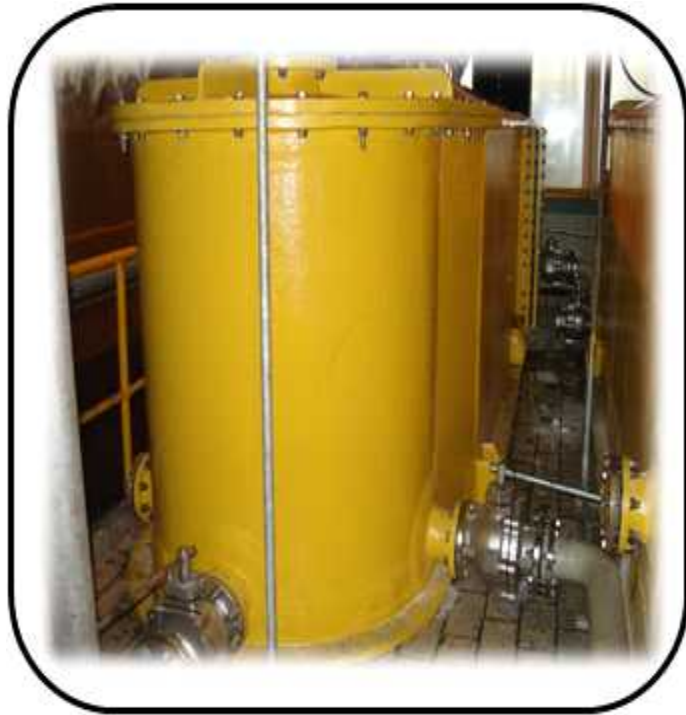
MIXER SETTLER 제작, 설치